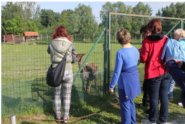
PRI MALIBUJU IMAJO MINI ZOO