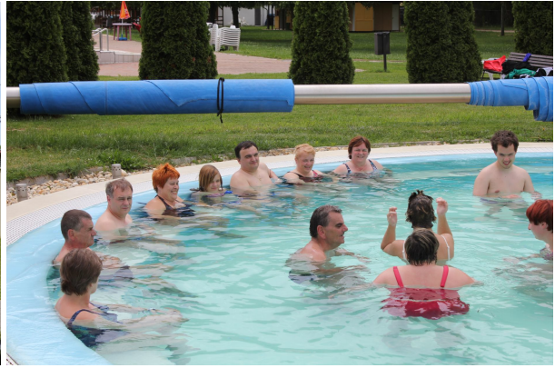
NEKATERI SO SE TUDI ZMOČILI