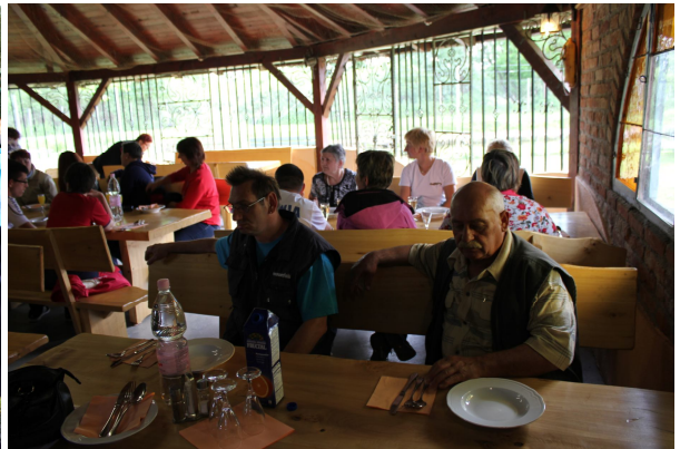
PA TUDI DOBRO HRANO