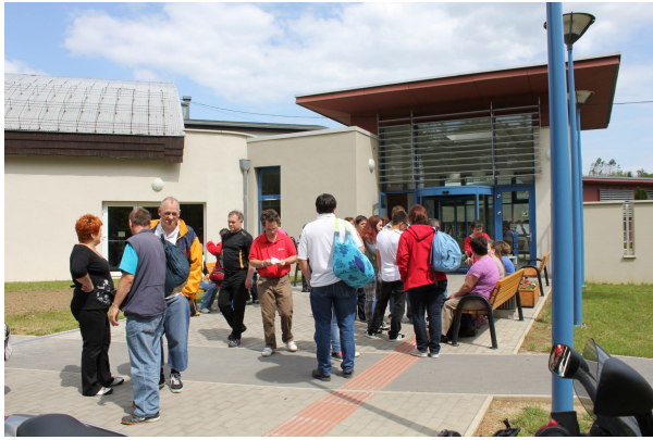
KAR TEŽKO SMO SE ODPRAVILI DALJE